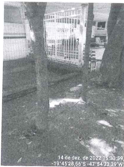
Figura 1 - Espécimes a serem suprimidos (à esquerda) e aqueles que necessitam de área permeável no entorno.